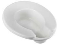
Hy21® Siège bassin avec fond