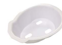
Cuvette avec trous