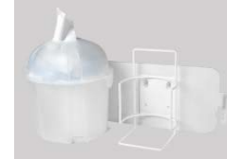
Plaque d'accessoires avec distributeur d'enveloppes hygiéniques et support pour lingettes désinfectantes