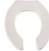
Siège Rond Ouvert Sans Couvercle