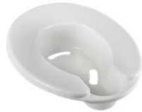
Hy21® Siège bassin avec trous