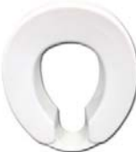
Hy21® Siège bassin sans fond